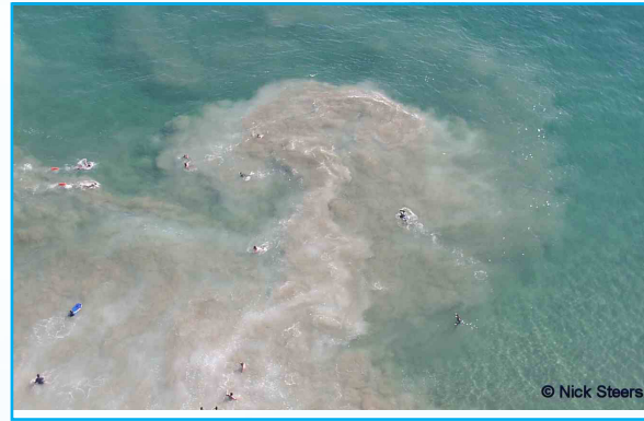
Las corrientes marinas en ocasiones crean una pluma de sedimento alejándose de la orilla.