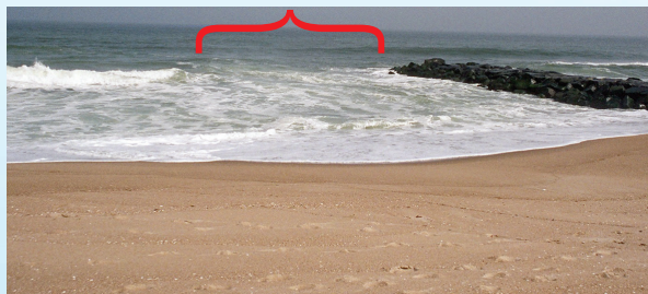
Con frecuencia la corriente marina se origina cerca de estructuras costeras.