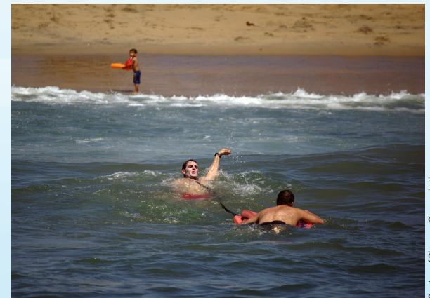
Un salvavidas rescata a un nadador atrapado en la corriente marina.