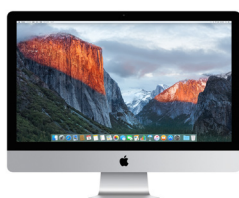
モデル MK142J/A、MK442J/A、MK452J/A 2015年10月13日発表